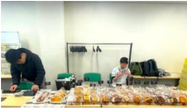
高田馬場福祉作業所『まりそる』 (パンの販売)