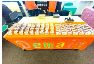
新宿第二あした作業所『デュマン』 (洋菓子の販売)