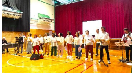
虹色楽団 from おとなのバンド倶楽部 『ライブ・パフォーマンス』