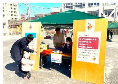
チャリティーサンタ北東京支部 『アドベンチャーBOUSAIパーク』