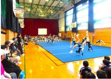
King of Cheerleaders' Association 『チア・パフォーマンス』