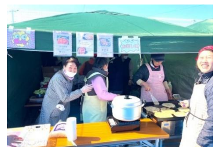
在日韓国福祉会『韓国家庭料理』