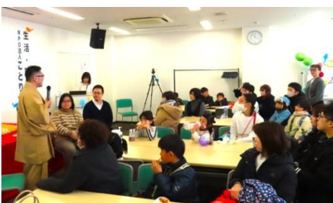
ことり企画『就労相談・落語』