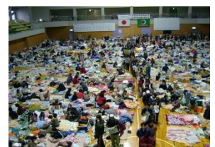
避難所運営の様子