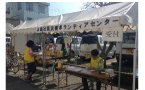
災害ボランティアセンターの一例