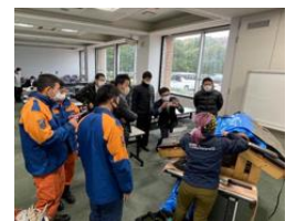
ブルーシート展張講習会の様子