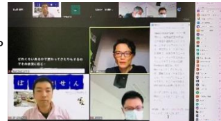
オンラインでのトークセッション