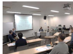
トークセッションの様子②