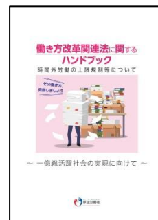
働き方改革関連法に関するハンドブック