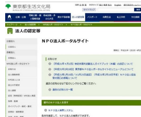
東京都NPO法人ポータルサイト