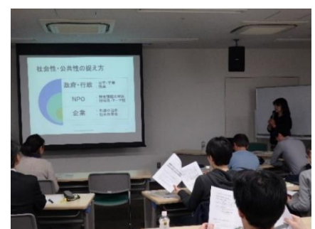
NPOの社会性・公共性を紹介