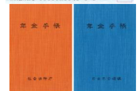
公的保険制度の 証明書や手帳