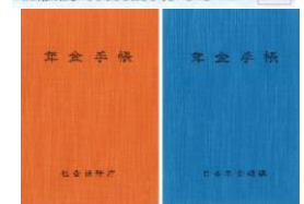
公的保険制度の 証明書や手帳