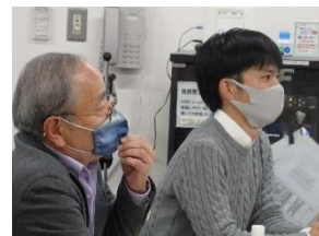
トークセッションの様子②