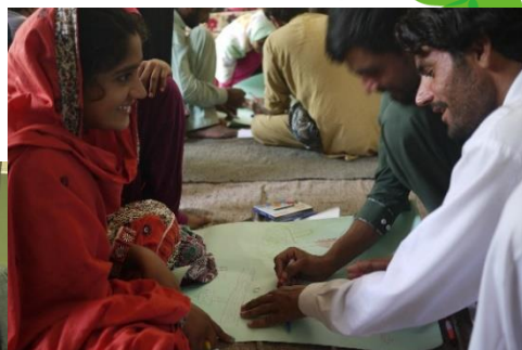
Bangladesh, Indonesia, Pakistan の教育関係者を対象とした教員交流支援プログラム