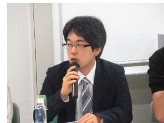
信田氏 (多文化共生センター東京)

サポートを受けたAさんからお話を伺いました。「17歳の時に母親の永住権取得に合わせて来日しました。高校生の時に多文化共生センター東京のサポートを受けてましたが、両親の都合で帰国させられました。しかし、日本で生活したいと思い、お金をためて来日しました。来日してからは、高校生の時のセンター講師から連絡をもらい、受験勉強やお金に苦労しているところを相談したことで無事に大学受験に合格することができました。現在、センターのインターンとして、研修会の通訳、学習支援等を行っています。」