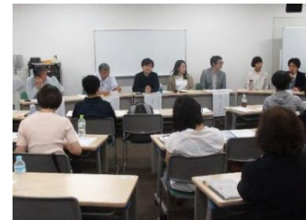
パネルディスカッションの様子①

A カ：その子がそのままであれば変わる必要はなく、その子が変わりたいと思ったら変わればよい。