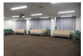
501会議室（定員72名） （部屋のレイアウトが自由に変更できます）