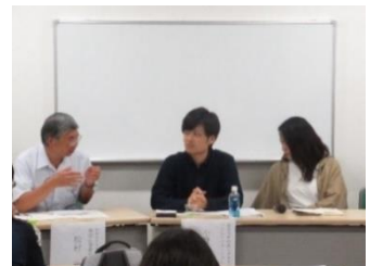
パネルディスカッションの様子②