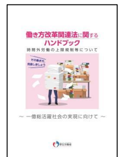
働き方改革関連法に関するハンドブック