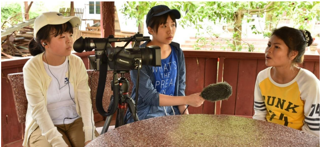
仲良くなった少女の辛い過去に真摯に向き合う友情のレポーター／2018年8月カンボジア

認定 NPO 法人国境なき子どもたちは、世界中の子どもたちが教育を受けることができ、お互いに友情を育み、成長し、夢を描ける社会の実現を目的に活動しています。これまで日本も含めた15カ国でストリートチルドレン、人身売買、東日本大震災等で被害にあった9万人以上の子どもと途上国にいる青少年たちに教育支援を行ってきました。また毎年、日本の子どもを海外の活動地に派遣して現地の子どもを取材し、日本のメディアなどで発信する「友情のレポーター」活動を行っています。