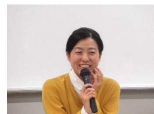
土岐氏 (ソーシャルベンチャー・パートナーズ東京)

クリスマスイブに子ども達に贈り物を届ける活動を行っている「NPO法人チャリティーサンタ」等、2005年から2018年までに49団体と協働を行ってきました。