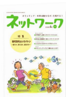
情報誌「ネットワーク」 （隔月発行）

東京都内におけるボランティア・市民活動の開発・発展を通じて市民活動の創造を目指すために、ボランティア・市民活動団体に対して必要な資金の助成を行っています。