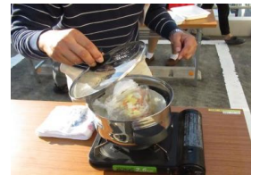
ポリ袋調理に挑戦

※NPO防災フォーラム：NPO災害復興支援プラットフォーム（事務局：新宿NPOネットワーク協議会）が主催し、NPOや地域団体等と一緒に万が一の災害に備えて対応を検討する場