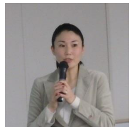
鈴木氏（二枚目の名刺）

「二枚目の名刺」では、社会人が本業以外に組織や立場を超えて新しい社会を創ることに取り組む“2枚目の名刺”を持つことが当たり前前の社会になり、2枚目の名刺の経験を通して自分自身が成長し、本業でも活躍する社会人を増やすことを目指しています。このような思いを持つ社会人とNPOを結びつけるため、「二枚目の名刺」では、Common Roomの開催とNPOサポートプロジェクトの推進を行っています。Common Roomはテーマ別に開催され、興味のある人ならば誰もが自由に参加できる場（但し支援依頼の発表を行うNPO団体は審査有）で、ここでNPOが自分の団体の活動を発表し、活動を支援してくれるメンバーを募集します。この発表に共感したメンバーがNPO団体と一緒にNPOサポートプロジェクトを立ち上げ、団体の事業推進の支援を行います。「二枚目の名刺」はコーディネーターとなり、プロジェクトメンバーとNPO団体を結び付け、プロジェクトの推進を支援します。