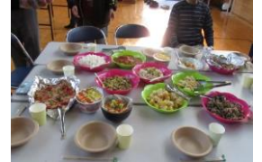
美味しく出来上がった料理の数々