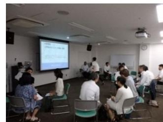
アイスブレイクの例 (3人1組で自己紹介)

ワールドカフェやブレインストーミング等で出た意見やアイデアをカードに書き出し、同じ系統のものをグループ化し論理的に整序することで、問題解決の糸口を探り出す手法のこと。