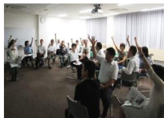
じゃんけんアンケートの例