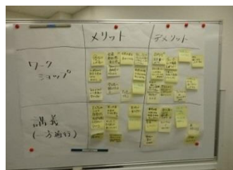
マトリックス法の例