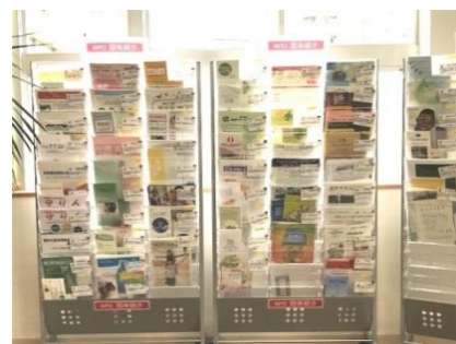
パンフレットスタンドへの配架例

4階フリースペースの『団体紹介用パンフレットスタンド』の利用団体を募集しています。是非ご利用ください。