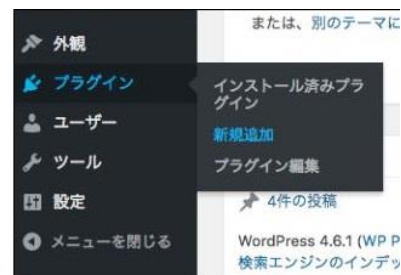
WordPressの編集画面例② (プラグイン追加画面)