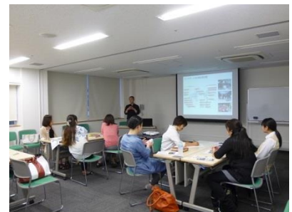
ボランティアの力を活かすコーディネート講座の様子

ボランティア側、受け入れ側も最後まで活動をやり遂げた達成感を持つことによって、互いの連携が良くなるだけでなく、違う現場でも経験が活かされます。