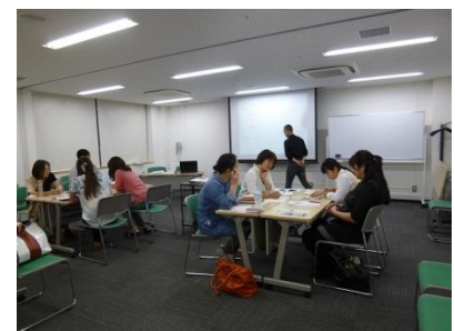
クロスロードゲーム※で意見交換をはかる参加者