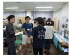
各団体のブースでPR

DOORS－日越交流プロジェクト 早稲田大学ボルネオプロジェクト いぐべおぐに NPO法人A SEED JAPAN