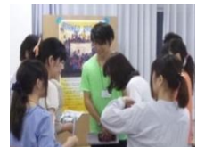
お互いに情報交換

ポスターセッションは、トークセッション開始前と交流時間に行われ、参加者は積極的にお互いの団体についてPRや情報交換をしながら交流を深めていきました。