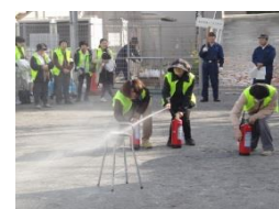
消火器を使って消火!!