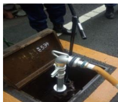
機材を取り付ける