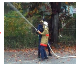
グラウンドに設置されたホースで消火!!