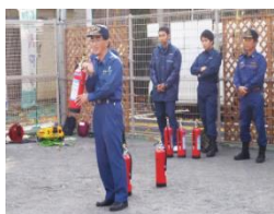
消防隊員から訓練について説明