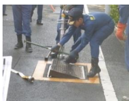
マンホールを開ける