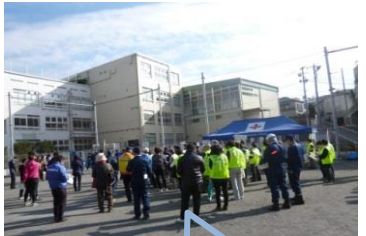
参加者は約121名(関係者も含む)

また防災ルームにおいて、戸塚特別出張所との通信訓練も行ないました。その他、新宿区が管理している備蓄倉庫の見学、戸塚警察署による救出用バッグや、避難所での間仕切りの実物の公開も行ないました。