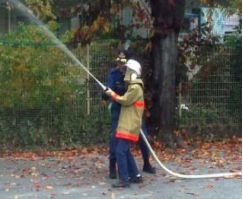
グラウンドに設置されたホースで消火!!