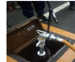
機材を取り付ける