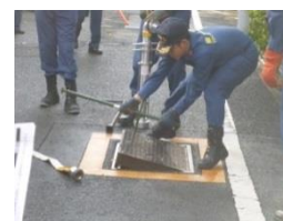
マンホールを開ける