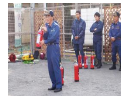
消防隊員から訓練について説明