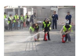
消火器を使って消火!!