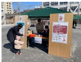
ウクレレプロジェクト （新宿まちなかサロン）