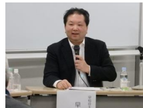
早田氏 (早稲田大学)