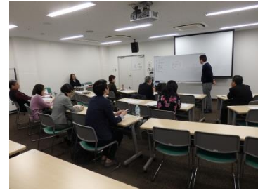
参加者による発表の様子

最後に講師から「事業を進めるには人と人の繋がりが大切です。ネットワークを構築し、コミュニティの場を形成して、お互いの価値観を醸成し、行政に頼るだけではなく、自分たちが自分自身で進めて行くことが重要です。」と事業を企画・推進していくためのアドバイスをいただきました。