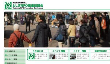
としまNPO推進協議会のホームページ ( http://toshima-npo.org/ )