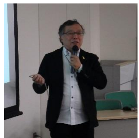
武澤氏(回復はどこにでもある)