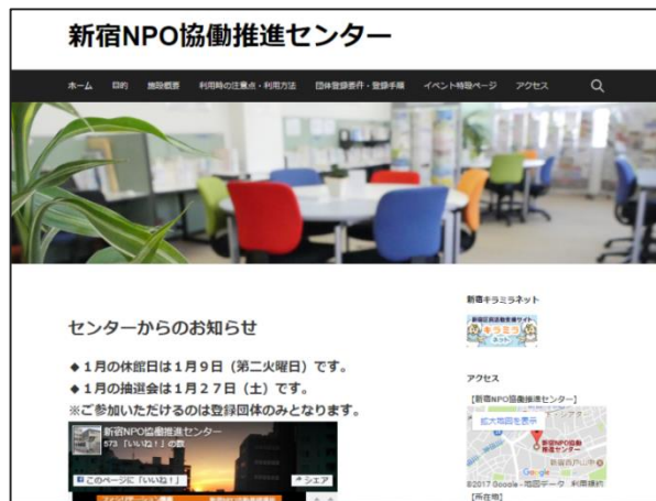
新宿NPO協働推進センターのホームページ