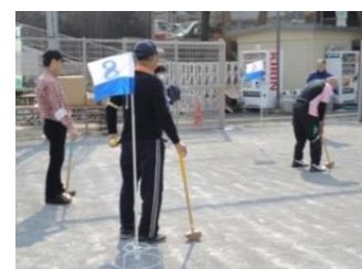
その他の事業（グラウンドゴルフ）