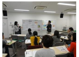
NPO活動基礎講座 (チラシ作成講座)