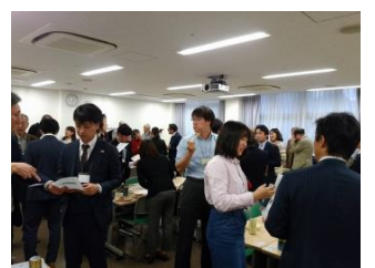
交流事業 (企業と NPOの交流)