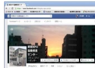
情報発信（フェイスブック）