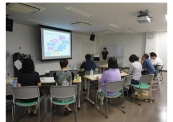
NPO活動基礎講座 (NPO入門講座)

※平成29年度分は本紙Vol.45で紹介しています。また、ホームページ ( http://snponet.net/ ) にも掲載しています。