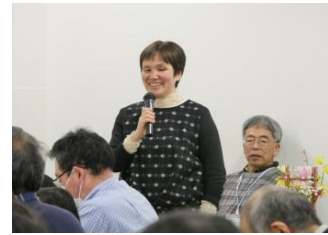
シンポジウム（障がいへの理解）