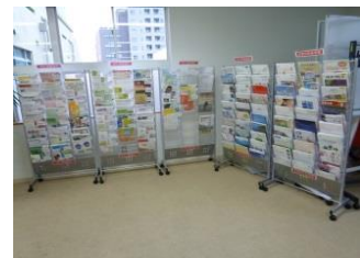
情報発信（パンフレットスタンド）