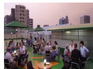
その他の事業（真夏の夜の交流パーティ）