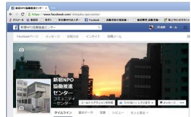
図2. 新宿NPO協働推進センターのfacebook画面

代表的なソーシャルメディアにはfacebook（図2）やtwitter（図3）がありますが、それぞれ特徴があり、伝えたい内容によって使い分けることにより効果的な広報活動が行えます。