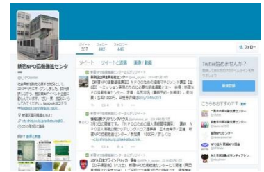
図3. 新宿NPO協働推進センターのtwitter画面